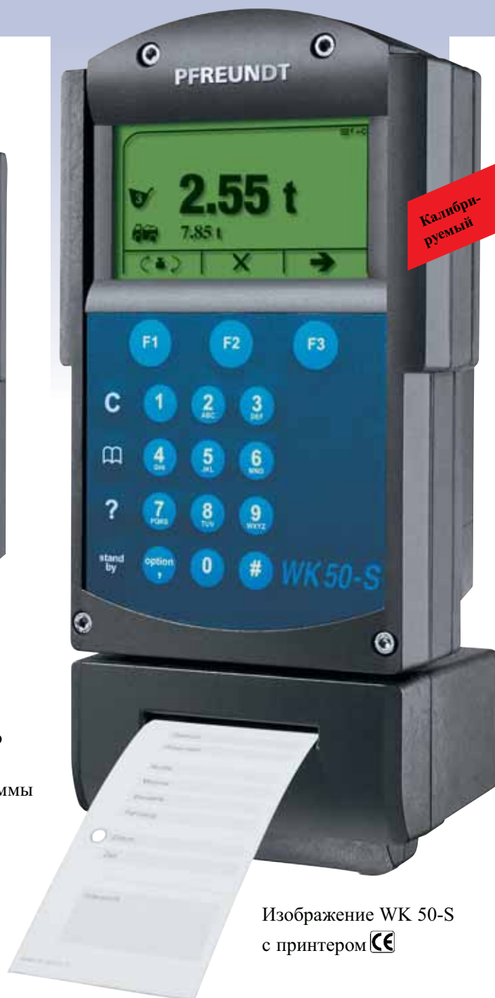
Изображение WK 50-S с принтером

Поменяв электронную систему, продукт легко модернизировать до WK 50.