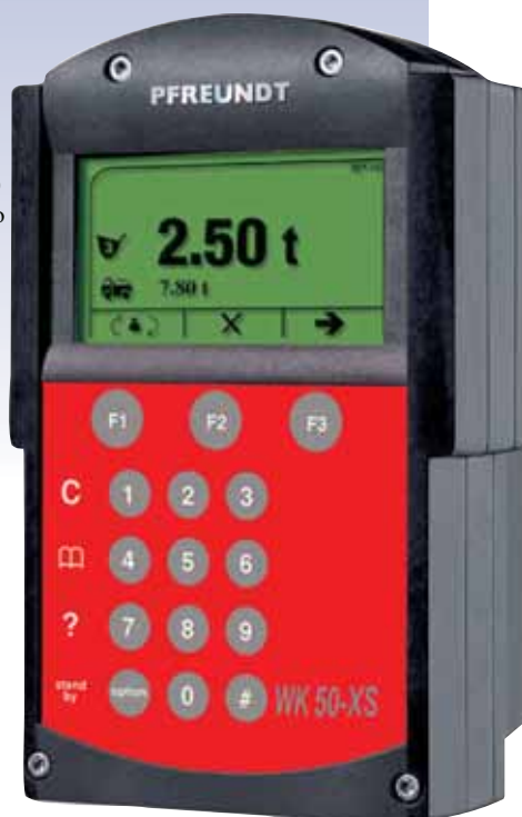
Изображение WK 50-XS

(* для переоснащения на WK50-S или WK50 для калибровочного режима требуется установка датчика давления с контролем температуры.